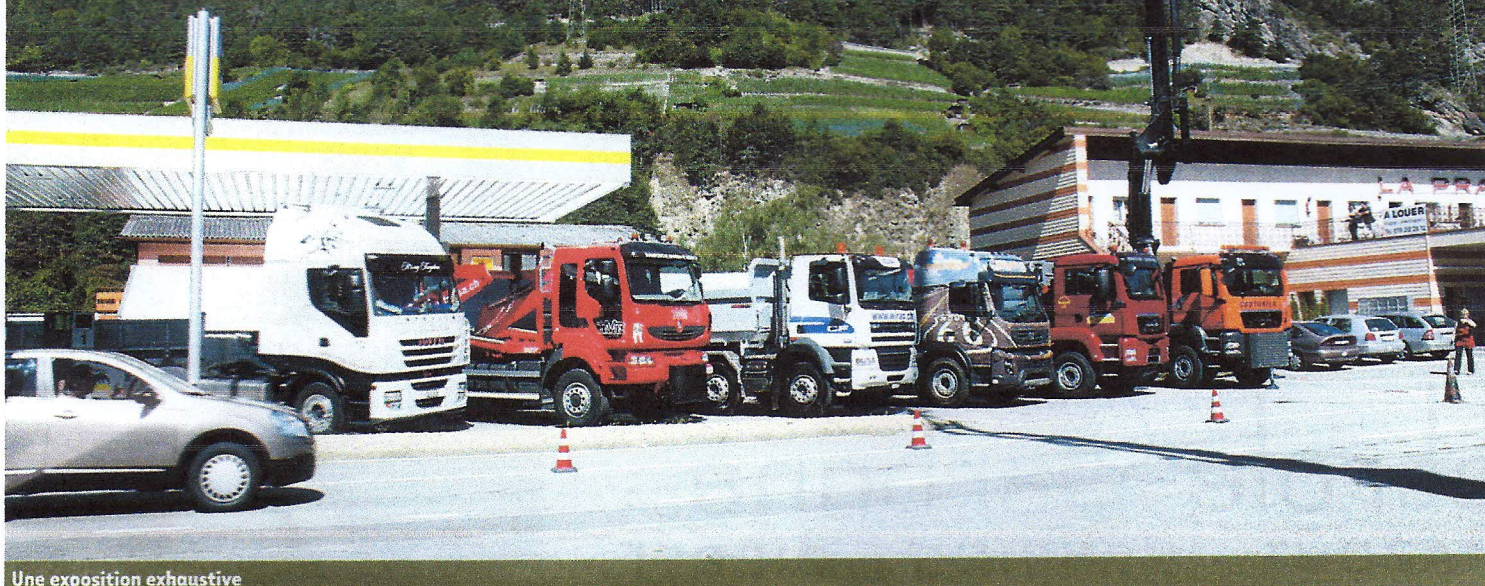
Une exposition exhaustive

Les organisateurs de ce 3 e Petit Salon dans la Prairie bien aidés par la Section Valais Plaine du Rhône des Routiers Suisses ont parfaitement